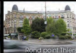
Rond point Thiers